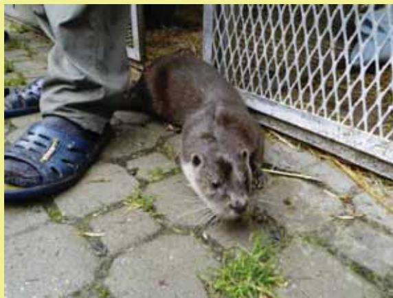
Od mláděte slepý samec vydry pojmenovaný Pind'our - v Záchrané stanici živočichů v Tachově (od Petry Sládkové)