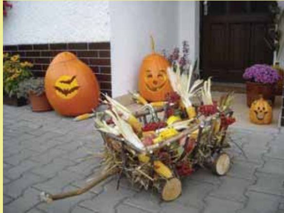
Podzimní inspirace (od Štěpánky Šimkové)

Chcete-li nám poslat fotografii (s popisem), která vás zaujala a chcete, aby ji viděli i ostatní, je tu pro Vás fotokoutek... Není rozhodující, zda jste autorem fotografie vy, váš známý nebo jste ji našli při brouzdání na internetu.