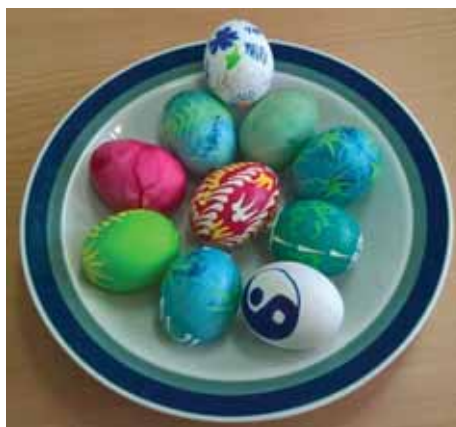
► Tak to jsou naše letošní vlastnoručně vyzdobené velikonoční kraslice