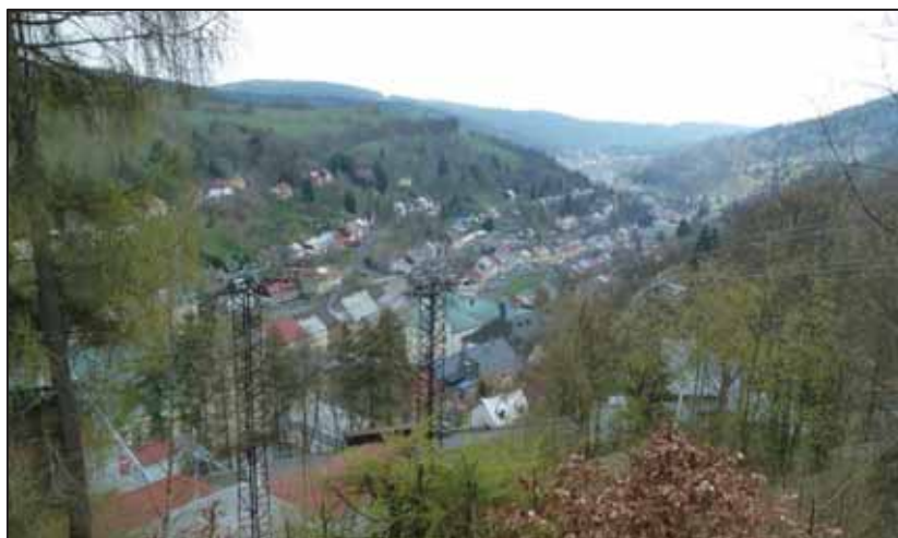
► Jáchymovské údolí

V našem kraji najdeme jenom málo míst, kde by bylo soustředěno tolik zajímavostí, jako v Jáchymově. Na jedné straně nádherné radonové lázně – nejstarší na světě – na druhé straně v kontrastu k tomu hrůza úmorné dřiny vězňů z padesátých let.