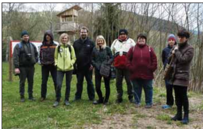
► Foto všech výletníků