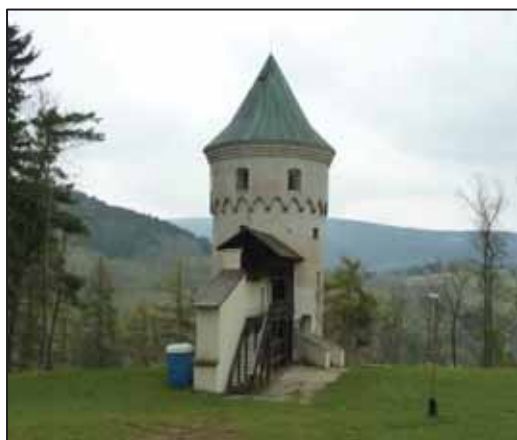
► Navštívili jsme i Šlikovu věž