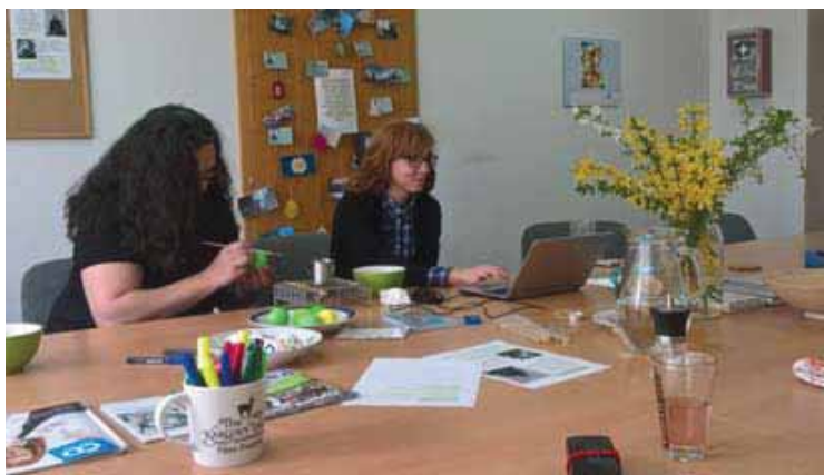
► Velikonoční, tvůrčí atmosféra ve vyzdobené sokolovské zasedačce

I Vám přejeme srdečně slunné jaro a plno sluníčka a energie, kterou všichni po dlouhé zimě tak potřebujeme. ◀