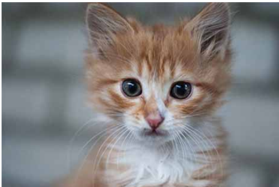
► Ilustrační foto

Některé příběhy působily až hrůzostrašně. Jeden z nás vyprávěl, že když byl malý, šel z plavání v Thermalu, zdržel se s kamarády a přišel domů pozdě. Jeho máma právě pracovala na šicím stroji, a přišla mu vynadat do kuchyně. V tu chvíli se utrhlo okno a spadlo přímo na šicí stroj, přímo na místo, kde se ještě před chvílí skláněla nad prací.