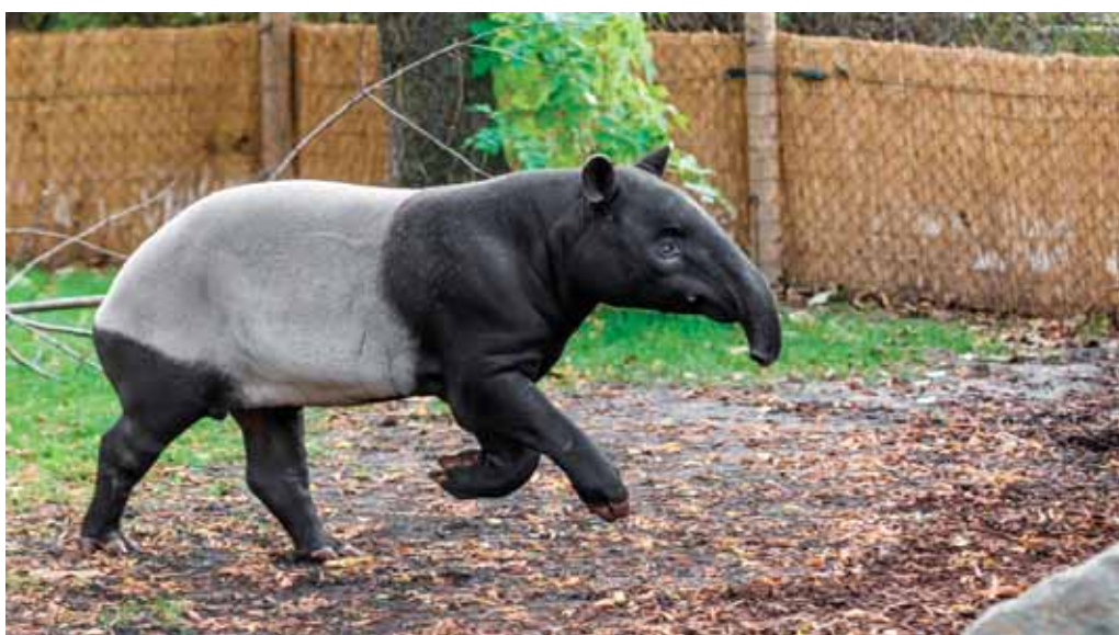
► Tapír čabrákový

Sice jsem věnovala své studium zvířecí tematice, ale vždy s cílem využít své poznatky při práci s lidmi. Náplní jest vše okolo asistenčních zvířat, hipoterapie, canisterapie, felinoterapie atd.