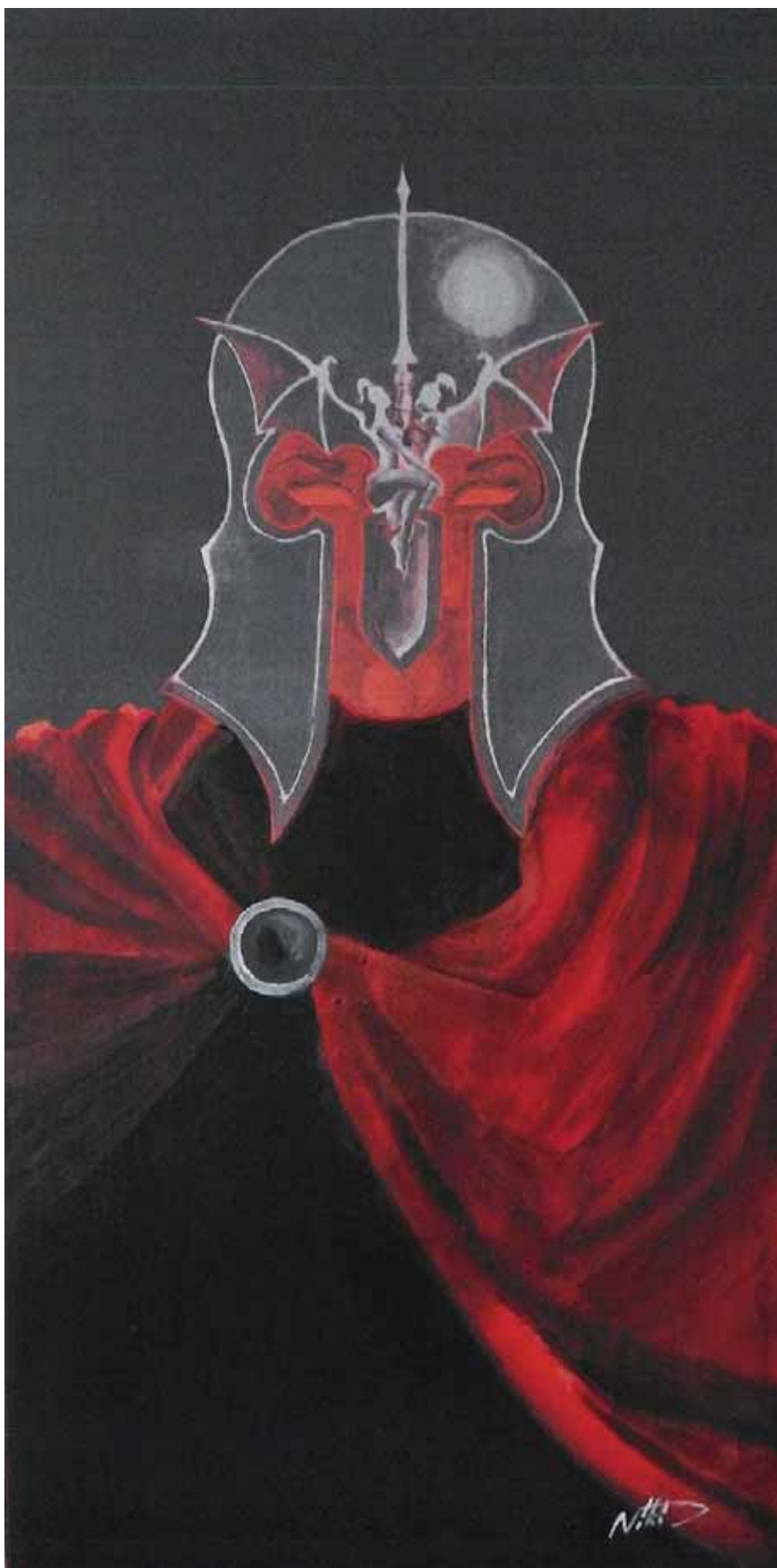
Helma rytíře (akryl, 2007)