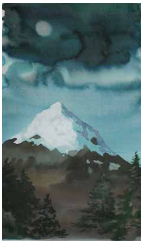
Hora s rozmazaným Měsícem