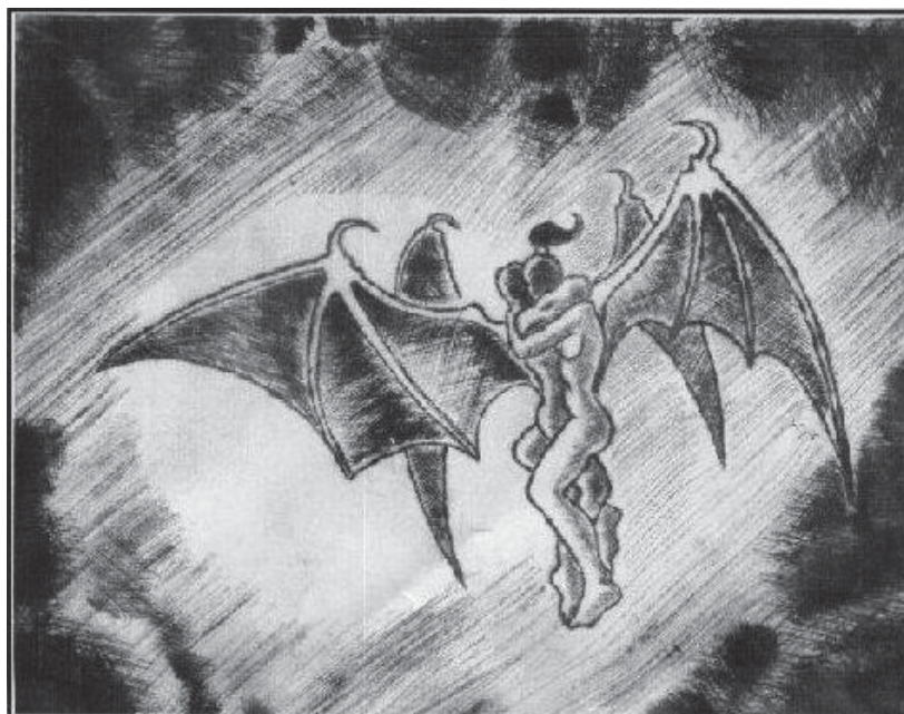
Netopýři lásky (rytina)